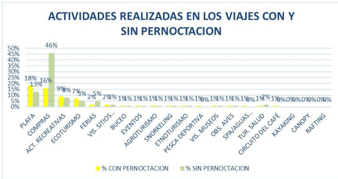
Fig. 1. Turismo Interno (Actividades realizadas en viajes con y sin pernoctar en Panamá)